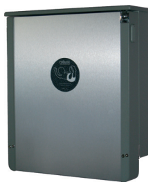
Robust Alu Harmaa pyökkirunko sekä alumiinilaminaatti etulevy