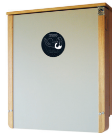
Robust Tammi Lakattu tammirunko sekä vaaleanharmaa etulevy