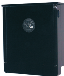
Robust Musta Musta pyökkirunko sekä mustaksi lakattu etulevy