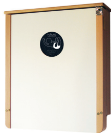
Robust Valkoinen Lakattu pyökkirunko sekä valkoinen etulevy

Robust-hoitopöydän design: Ingvar Persson Valmistaja: Skötbordspecialisten AB, Ruotsi