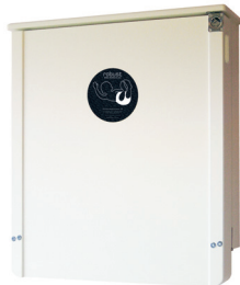
Robust Kokonaan valkoinen Valkoinen pyökkirunko sekä valkoinen etulevy