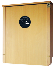
Robust Pyökki Lakattu pyökkirunko sekä pyökkikuvioinen etulevy